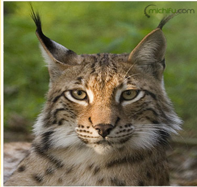
Imagen de un Lince Lynx lynx , una de las cerca de 2 millones de especies identificadas que forman parte de la Biodiversidad en el mundo.